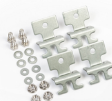
Kiinnityskorvat, 20 mm korkea, 4 kpl:n setti, EFFL3.20